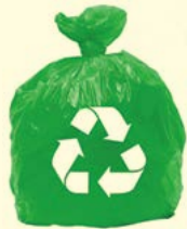
Sisa Kitar Semula